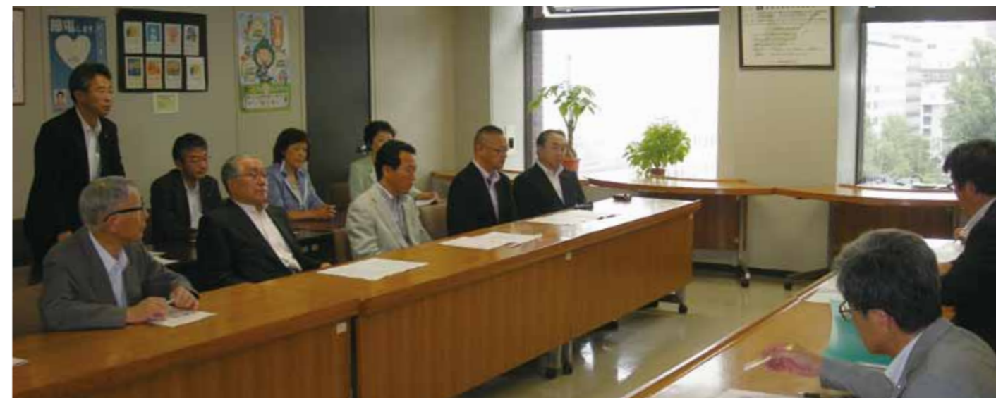
「高等養護学校をつくる会」や「道立特別支援学校高等部誘致期成会」とともに要望活動

残念ながら目標の2014年度は既設の美深に1学級を増設し、新設2学級は愛別町となりましたが、旭川市については道教委の配置計画に異例の注釈がつき実質「2016年度」開設を担保することになりました。