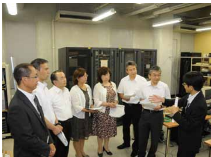
旭川のIT会社コンピュータ・ビジネスのデータセンターを視察