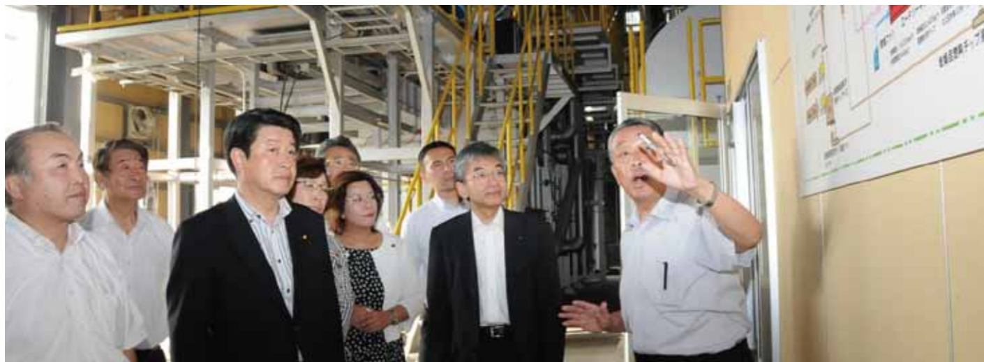
北海道健誠社（東神楽町）の木質バイオマス発電施設を視察