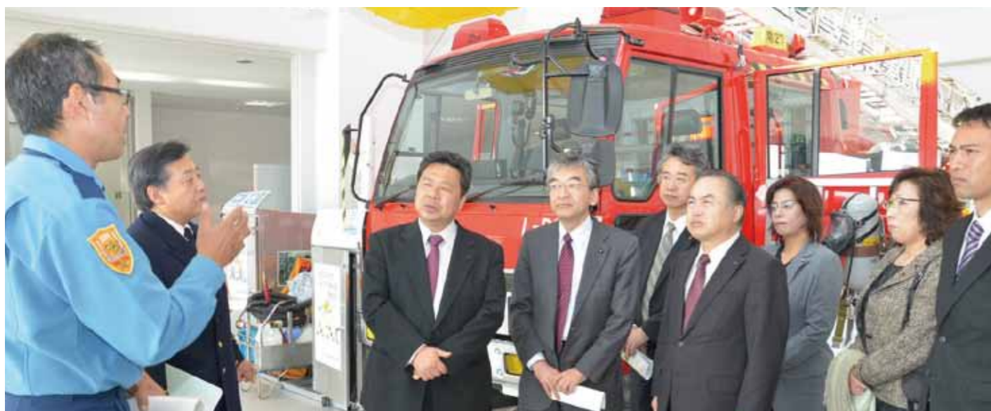
旭川市総合防災センターで説明を受ける